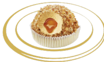
IGLOU crème brûlée Glace Vanille au coeur fondant au caramel Fr. 6.50