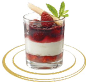
Panna Cotta Fr. 8.50