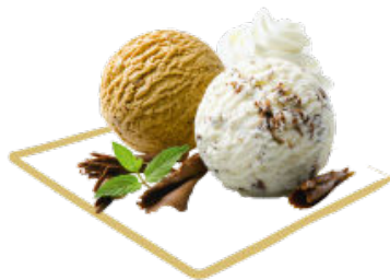
Deliziosa Crème glacées Stracciatella et Mocca, sauce chocolat et copeaux de chocolat Fr. 9.80