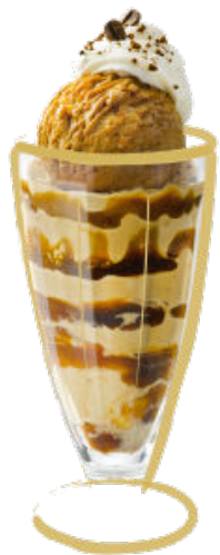
Café Glacé Crème glacé Mocca, coulis de café et crème Fr. 9.50