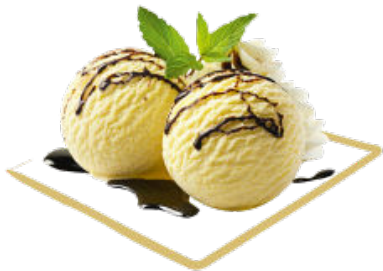
Danemark Crème glacée Vanille, sauce au chocolat et crème Fr. 9.80