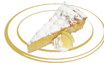
Torta de la Nonna Fr. 7.00