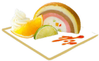
Cassata Sicilienne arrosée Maraschino Fr. 7.50