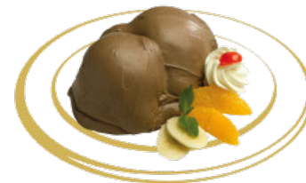
Profiterol Fr. 7.50