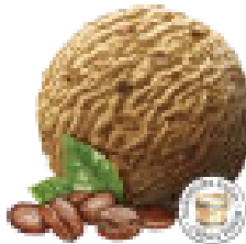
Mocca* *a. noisettes croquantes