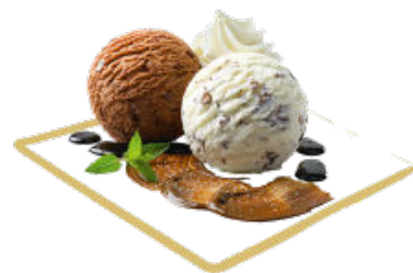
Capricciosa Crèmes glacées Stracciatella et Chocolat, sauce chocolat et tiramisu maison Fr. 9.80