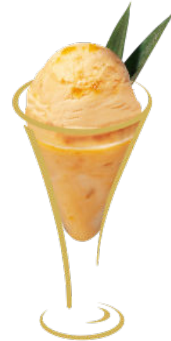
Valaisan Sorbet Abricot arrosé d'eau de vie d'abricot Fr. 9.50