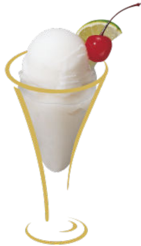
Colonel Sorbet Citron arrosé de Vodka Fr. 9.50